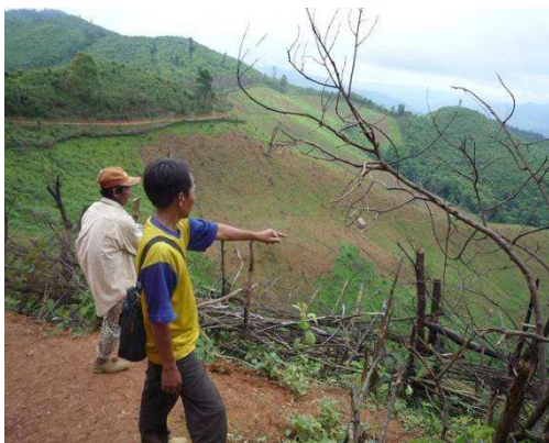
สำรวจเพื่อเตรียมที่ดินและแบ่งเขตป่าไม้

ตั้งแต่ปี 2548 (2005) แม่โขงวॉช ได้ทำงานร่วมกับคณะป่าไม้ มหาวิทยาลัยแห่งชาติลาว เพื่อดำเนินโครงการจัดการป่าต้นน้ำที่เมืองปากแบ่ง โดยมีดำเนินการสำรวจและได้มีข้อเสนอแนะออกมาดังนี้คือ 1) บรรลุวิธีการบริหารจัดการป่าต้นน้ำที่ประนีประนอมระหว่างการอนุรักษ์ป่าไม้และรักษาวิถีชีวิตชาวบ้าน 2) สร้างกลไกให้ชาวบ้านมีส่วนร่วมในการตัดสินใจที่เกี่ยวข้องกับประเด็นการใช้ประโยชน์ที่ดินและป่าไม้ 3) มั่นใจได้ว่านโยบายที่ออกโดยส่วนกลางควรจะสะท้อนปัญหาที่เกิดขึ้นในพื้นที่อย่างเป็นธรรม