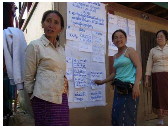
การจัดประชุมเชิงปฏิบัติการเพื่อหารือเกี่ยวกับการใช้ประโยชน์ที่ดินในหมู่บ้าน