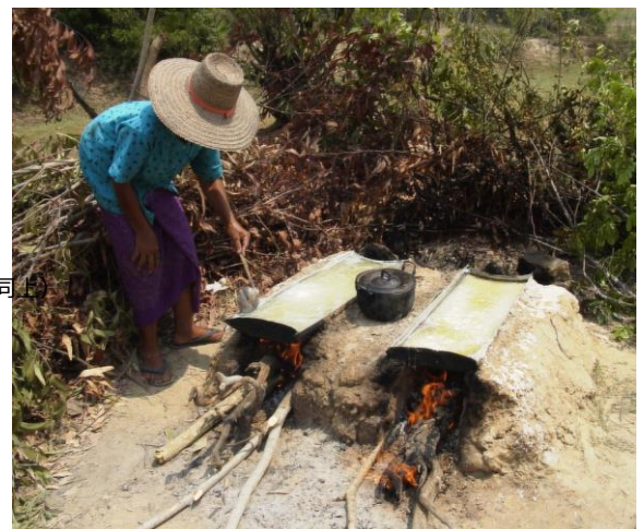
炎天下、岩塩を溶かした塩水を煮詰める女性（東北タイ）

→お申込 https://ssl.form-mailer.jp/fms/8842e496342019