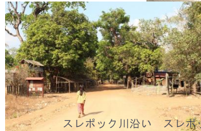
スレポック川沿い スレポック・トム村