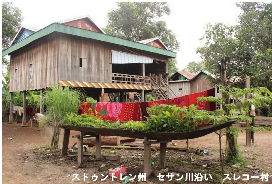
ストウントレン州 セサン川沿い スレコー村